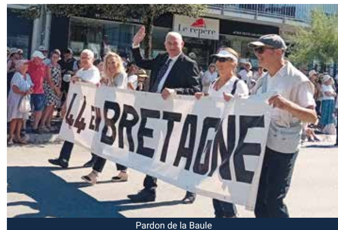
Pardon de la Baule