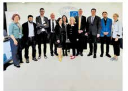
Les membres de la délégation, représentants de Bretagne Réunion, Kenleür et Produit en Bretagne avec les eurodéputés de l'Intergroupe Minorités traditionnelles, communautés nationales et langues du Parlement européen

Les échanges nourris avec les eurodéputés ont ouvert des perspectives de nouveaux contacts et de collaborations à venir. La Bretagne puissance 5, par sa vitalité culturelle et économique, s'affirme ainsi comme un modèle de territoire européen durable, humain et inspirant.