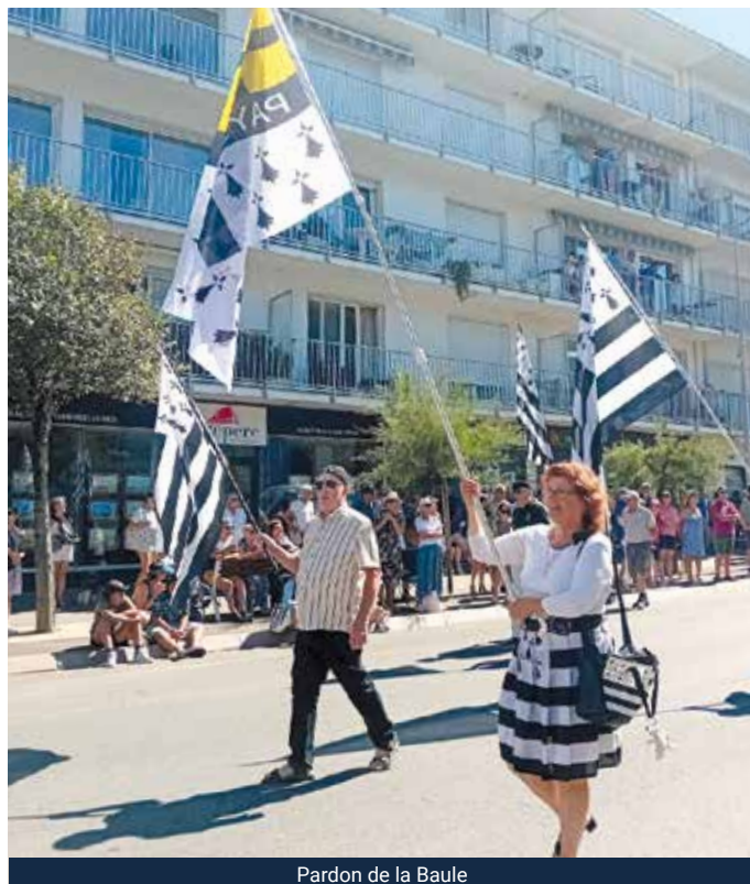
Pardon de la Baule