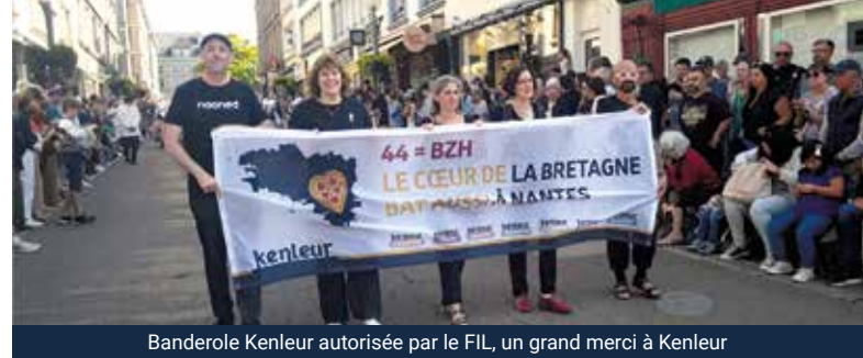
Banderole Kenleür autorisée par le FIL, un grand merci à Kenleür