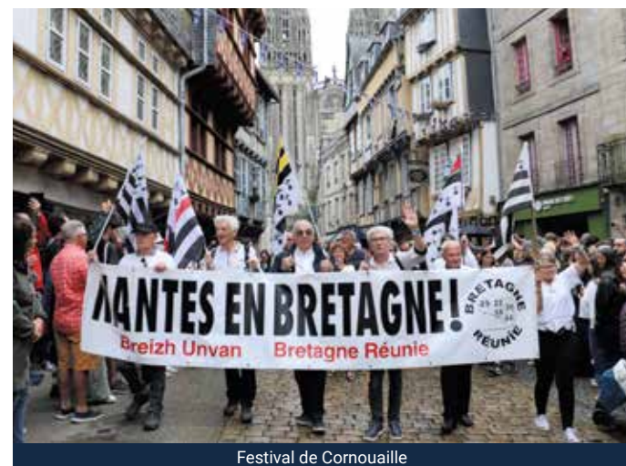
Festival de Cornouaille

Le Comité local Quimper-Cornouaille de Bretagne Réunie a défilé avec sa banderole « Nantes en Bretagne » au Festival de Cornouaille le dimanche 27 juillet 2025. Comme chaque année notre banderole et nos militants ont été très applaudis par le public tout le long du parcours. Notre présence a rappelé aux nombreux spectateurs que la Bretagne c'est 5 départements unis comme les 5 doigts de la main. Bretagne Réunie Kemper a remercié le Festival de Cornouaille pour son accueil.