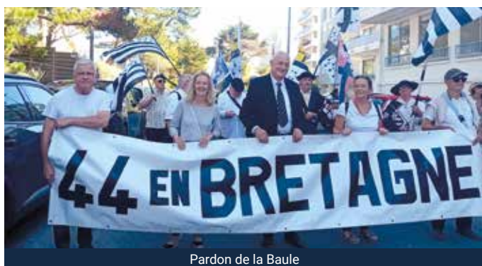
Pardon de la Baule