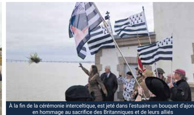
À la fin de la cérémonie interceltique, est jeté dans l'estuaire un bouquet d'ajonc en hommage au sacrifice des Britanniques et de leurs alliés

Alors que la cérémonie interceltique a lieu une heure avant l'officielle et bénéficie de l'antériorité sur le site, et donc interfère aucunement avec cette dernière, les services municipaux multiplient les intimidations. Cela va de l'installation de barrière pour empêcher l'accès sur la jetée à la présence menaçante de policiers municipaux qui tentent tous les ans de dissuader les participants d'approcher des lieux. Pour la mairie, il est insupportable de voir des Gwenn ha Du et drapeaux des nations celtiques à cette occasion. Nos amis britanniques sont stupéfaits de l'attitude municipale et ont envoyé ces dernières années plusieurs courriers au maire. Une année, on assista même à une scène déplorable où les services de la Ville ordonnèrent à une Galloise, fille d'un vétéran, de